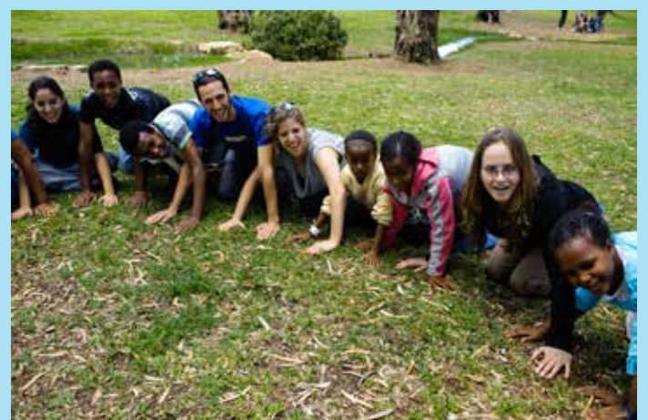
› Godt forhold mellom Selahs ansatte, frivillige og deltagere på seminaret fører til trygghet, nære bånd og fortrolighet.

Takket være Selahs støtte til dem, deres egen innsats, og våre mange faddere her i Norge går det bedre med mange av familiene. Og det synes både på humør og på karakterkortet. HJHs faddere gjør en uvurderlig forskjell i disse barnas liv. Tusen takk hver en av dere! ■