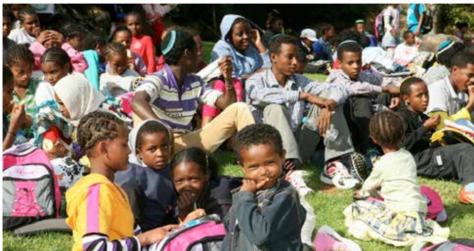
› Barn og unge fra IBIM-senteret i Negev på tur til Jerusalem Zoo i november.