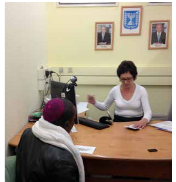
› Selv om det er flere generasjoners lengsel som nå blir oppfylt, er det mange formaliteter som må ordnes.

Klokken er 4.15. Dagen i Israel begynner snart, men dagen har allerede startet for disse 52 nyeste av Israels immigranter. Det har vært en følelsesladet og inntrykksrik morgen for oss alle sammen. Vi vinker farvel og ønsker dem alt godt i deres nye tilværelse.