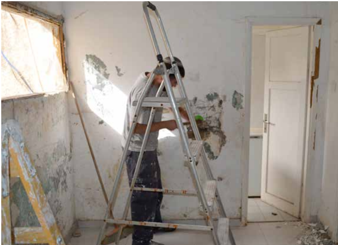
› Livnot er på plass for å hjelpe. Mye må gjøres, men det vil bli fint.